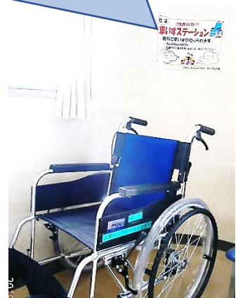
▲残堀・伊奈平地区会館の車いすステーション

武蔵村山市社会福祉協議会では、車いすステーションを市内に順次増やしていきます。ご協力いただける施設、商店、自治会等ございましたら、ご連絡ください。