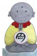
マスコットキャラクター