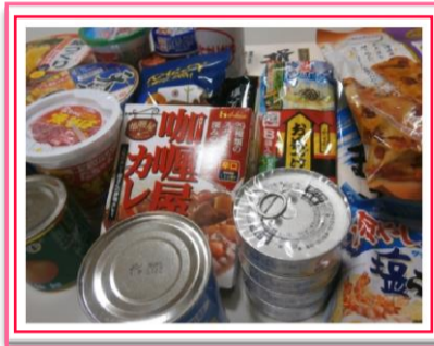
(ご寄附いただいた食料の一例)

食料のご寄附をいただいた方々には、この場を借りてお礼を申し上げます。これからも、地域の方々のお気持ちをつないでいきたいと思ひます。