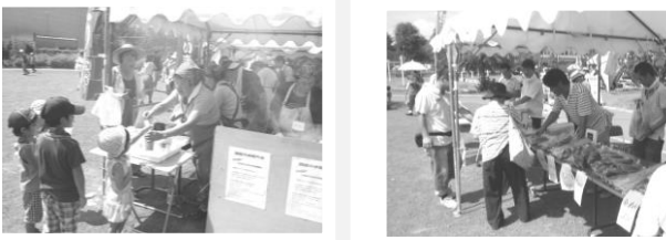
*写真はH25年「福祉まつり」の様子