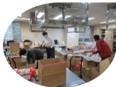
【フードバンク事業ボランティアへの参加】

★社会とのつながり回復支援 本会フードバンク事業の仕分け作業等をお手伝いいただいています。ココカラサロンの参加者と一緒に新しいプログラムを考えています。