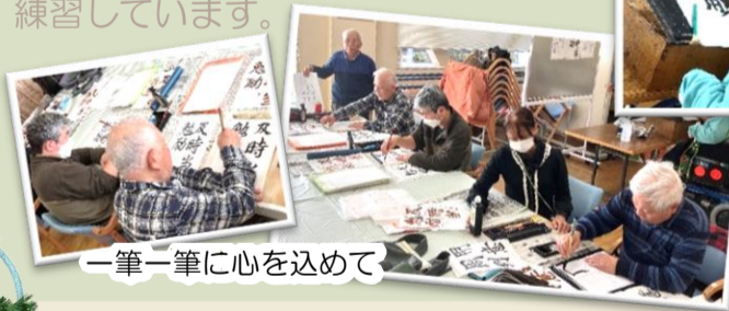
一筆一筆に心を込めて