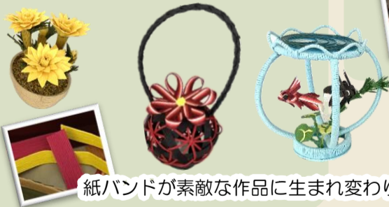
紙バンドが素敵な作品に生まれ変わります