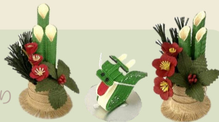
◆◆ 講座受講生の作品 ◆◆

毎年12月3日から9日までの「障害者週間」に合わせて総合センター内で実施されている作品展に、本会身体障害者福祉センターの利用者と講座受講者の作品が展示され、12月1日から15日までの期間、市民総合センターのロビーを飾りました。